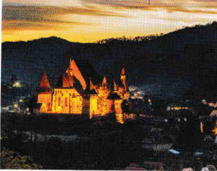
Biserica fortificată din Biertan (1490-1520) The fortified church of Biertan (1490-1520)

pastoral calendar, which is punctuated by Christian and pre-Christian holidays. In the countryside, customs that once had a powerful magical and mystic charge have not been forgotten, nor have certain archaic crafts, such as woodworking, the weaving of woollen rugs and traditional costume, pottery, and the painting of Easter eggs. This world rooted in the past provides an opportunity not only for vividly coloured photography, but also for experiences whereby you can discover the most authentic image of Romania.